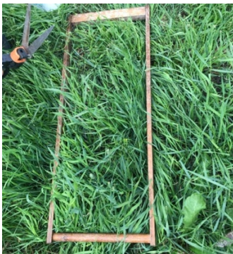
Kuvio 1. Tiheä nurmikasvusto.

Laidunnuksen perustana on hyvä nurmikasvusto. Hyvä nurmi on tiheäkasvuista, maittavaa, tallauksen kestäväää ja sen jälkikasvukyky on hyvä. Hyvässä nurmessa on useampaa eri kasvia, eli se on seoskasvusto. Kun kasvusto on monipuolista, useita eri lajeja ja lajikkeita sisältävä, se kestää säiden ääri-ilmiöitä paremmin ja antaa näin todennäköisemmin paremman sadon kuin yhtä tai kahta lajia sisältävät nurmet. Monipuolisen kasvuston on osoitettu lisäävän myös maaperän mikrobien monimuotoisuutta, joka on yhteydessä maan parempaan mururakenteeseen, sekä pysyvien hiiliyhdisteiden syntyyn eli hiilen sidontaan.